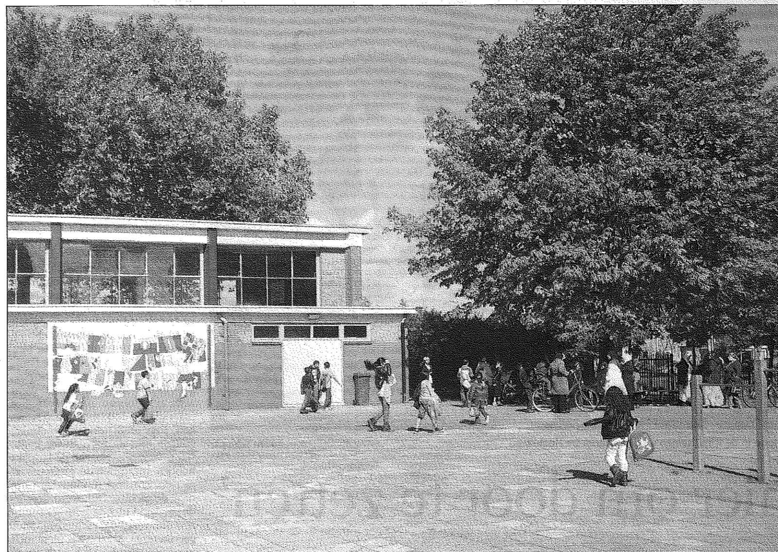
De schooldag zit erop voor deze kinderen. Het kenniscentrum van de Stichting PrOo kan bijspringen waar dat nodig is. Of het nou gaat om een leerling die moeite heeft met de lesstof, of een hoogbegaafde scholier die op school de uitdaging mist.